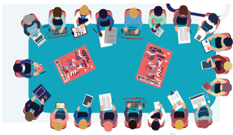
La Vie collégienne